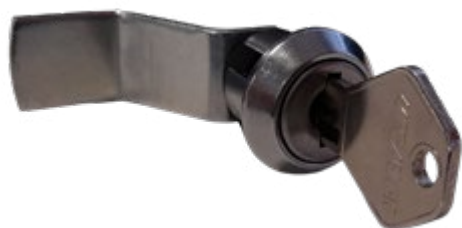
Fechadura para cacifos metálicos