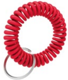
Bracelet en spirale