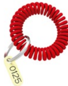
Bracelet en spirale avec numérotation.