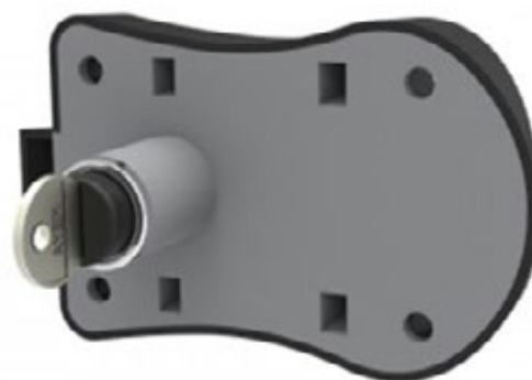
Serrure pour casiers non métalliques